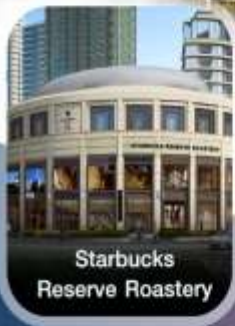
Starbucks Reserve Roastery

เทศกาล สงกรานต์ ✓คอนเฟิร์มออกเดินทาง ทุกพีเรียด 2 ท่านขึ้นไป