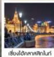
เซี่ยงไฮ้ คคลาศสิกไนท์