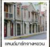
แลนด์มาร์กจางหยวน

เซี่ยงไฮ้ คคลาศสิก ไท์ / 3 ดึกใหญ่แห่งเซี่ยงไฮ้ คองเรือหมู่บ้านโบราณจูเจียเจียว / EKA Tianwu / วัดหลงหัว แลนด์มาร์ก จางหยวน / ถนนหวยไห่ / ชมโชว์ ERA ที่โรงละครโด่งดังระดับโลก / ซินเทียนตี้