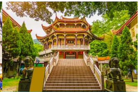
วัดหนานกุ้ยซื่อ