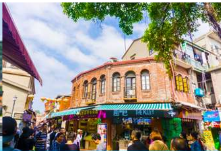
ถนนคนเดินหัวมังกร