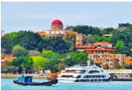
เกาะกู่ลิ่งหยวี

พักที่ โรงแรม XIAMEN HENGLONG HOTEL 4* หรือเทียบเท่าในเซี่ยเหมิน