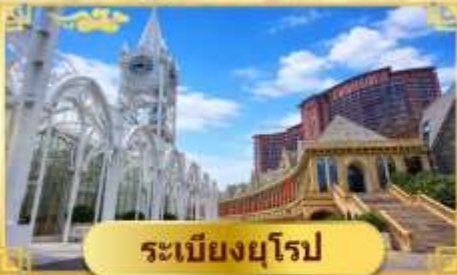
ระเบียบยุโรป