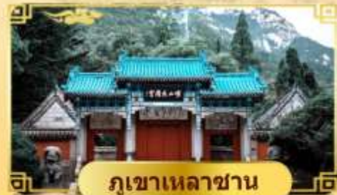
ภูเขาเหลาซาน