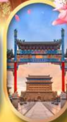
ถนนคนเดินเจียมเหมิน