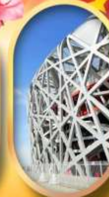
ผ่านชมสนามกีฬาโอลิมปิก