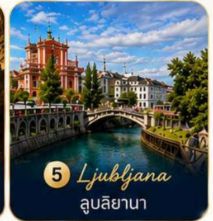
5 Ljubljana ลูบลิยานา