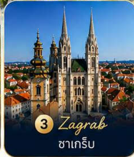
3 Zagreb ซาเกร็บ