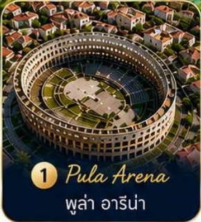
1 Pula Arena ปูลา อารีนา