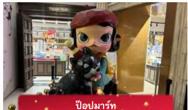
ป๊อปมาร์ท