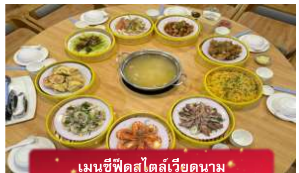
เมนูซีฟู้ดสไตล์เวียดนาม

17.05 เดินทางถึง สนามบินสุวรรณภูมิ โดยสวัสดิภาพ ... พร้อมความประทับใจ