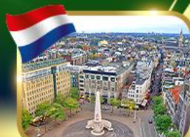
จัตุรัสดันสแควร์ อัมสเตอร์ดัม