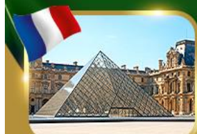
พีระมิดที่ลูฟวร์ ปารีส