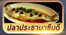
ปลาประรานาธิบดี