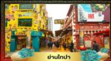
ย่านโกปา