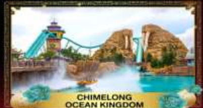
CHIMELONG OCEAN KINGDOM