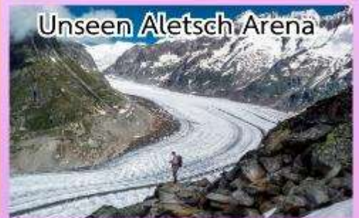
Unseen Aletsch Arena

ชมความงดงามของทะเลสาบเจนีวา ชมปราสาทชิลองที่เมืองมอว์คเทออร์ช ล่องเรือชมความงามของทะเลสาบ ลูเซิร์น, พักในหมู่บ้านเซอร์แมท (เมืองตากอากาศปลอดมลพิษ ที่ได้ ชื่อว่าสวยงามเหมือนสวรรค์บนดิน)