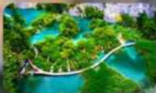
อุทยานแห่งชาติพลิวีเซ่