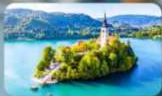
โบสถ์พระแม่มาเรียแห่งบลัด