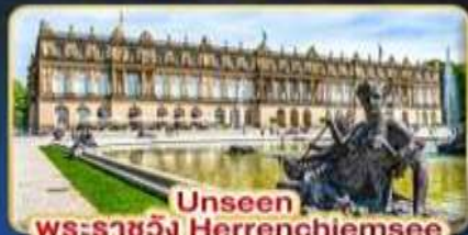
Unseen พระราชวัง Herrenchiemsee

📅 เดินทาง : 3-10 เม.ย. | 7-14 เม.ย. 30 เม.ย. - 7 พ.ค. 69