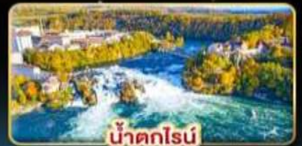
น้ำตกไรน์