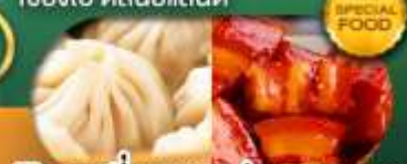
พิเศษ เสี่ยวหลงเป่า หมูคังพอ เดินทาง ม.ค. - มิ.ย. 69