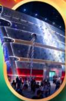
เรือคองคอลลีย์