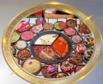
บุฟเฟ่ต์มือโหลงซิ่ง