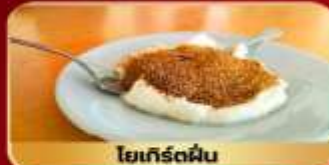
โยเกิร์ตผืน