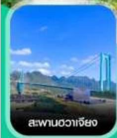
สะพานฮวาเจียง

เช็กอินก่อนใคร สะพานที่สูงที่สุดในโลก สะพานฮวาเจียง น้ำตกหวงกั๋วชู่ หมู่บ้านวู่เจียจ้าย