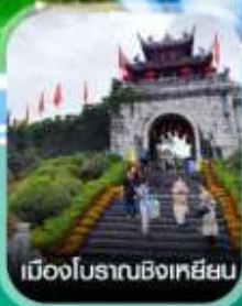
เมืองโบราณชิงเคียม

คอนเฟิร์มออกเดินทาง ทุกพีเรียด 2 ท่านขึ้นไป