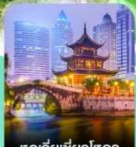
หอเจียเซียวโหลว