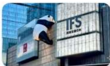
แพนด้าป็นตัก IFS