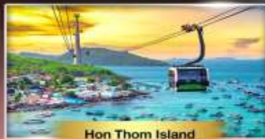
Hon Thom Island