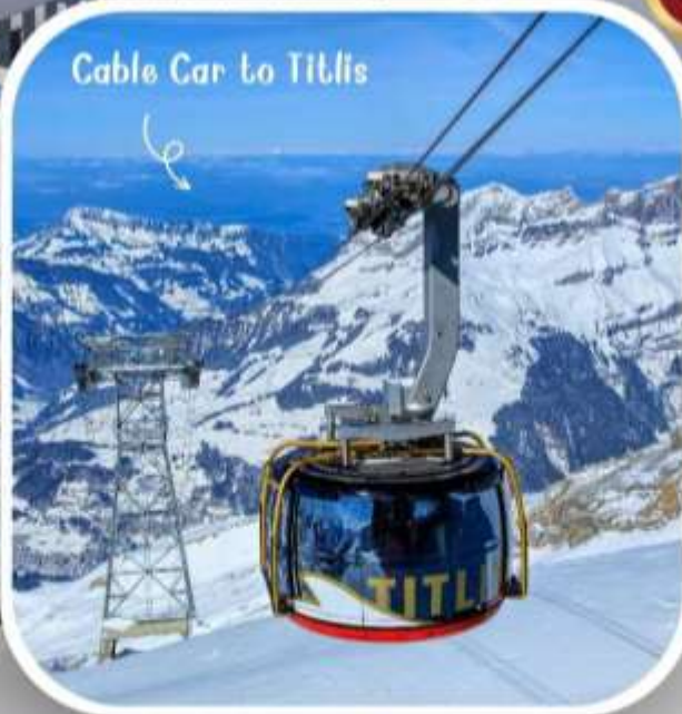
Cable Car to Titlis