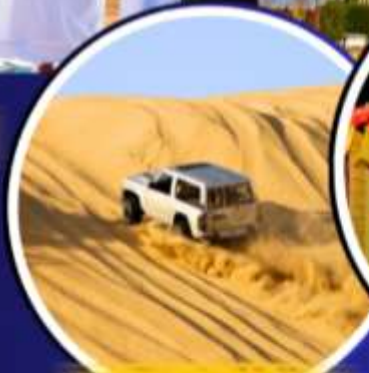
รถเช่าราย 4X4