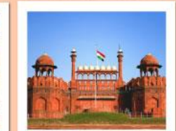
♥♦♦ Agra Fort