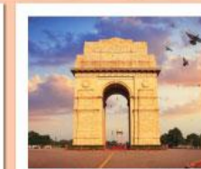
♥♦♦ India Gate