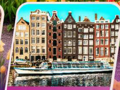
ล่องเรือหลังคากระຈก