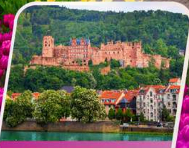
เข้าชมปราสาทไฮเดลเบิร์ก