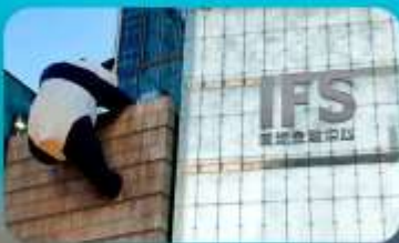
ถนนคนเดินซุนซีลู่