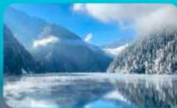
จี๋จ้ายโกว